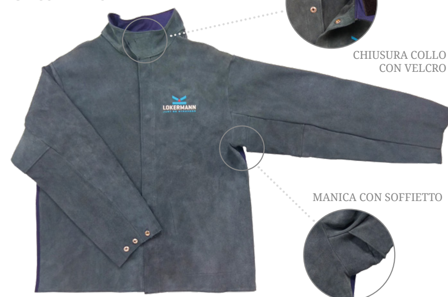
GIACCA LKM SYLE