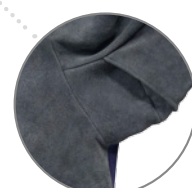
MANICA CON SOFFIETTO

Particolare attenzione è stata dedicata alla creazione della Giacca LKM Style: caratteristiche che garantiscono comfort al saldatore come la pelle scamosciata di alta qualità, il tessuto ignifugo sulla schiena ed il taglio morbido e, oltre a questo, alcuni piccoli accorgimenti come la chiusura del collo con il velcro ed i soffietti aggiunti sotto la manica, permettono movimenti più ampi senza scoprire le parti del corpo più a rischio come collo e polsi.