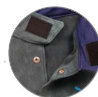
CHIUSURA COLLO CON VELCRO